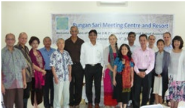
Miembros de la Zona 1 y 2 en el Complejo de Rungan Sari