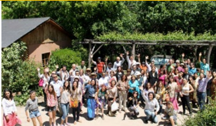
Más de 100 personas viajaron a las montañas del Cajón del Maipo, Chile, para el Encuentro de la Zona 9.

La reunión de la Zona 9 resultó un bienaventurado y feliz evento donde todos trabajaron mucho. La gente experimentó profundamente el latihan y las sesiones kejiwaan, en una atmosfera muy familiar y salpicada de expresiones culturales- dijo Elías”