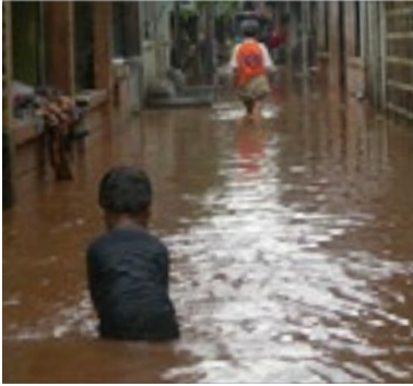
Foto: Donaciones a Ayuda Mutua en apoyo a las víctimas de las inundaciones en Jakarta en 2007

Lean más sobre el Programa de la WSA “Ayuda Mutua” en la sección de los Programas Subud: