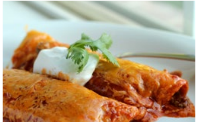
Se está preparando un menú muy variado y Puebla es conocida por la auténtica cocina mexicana

Contamos con una selección de empresas de catering ofreciendo sus servicios. Una de ellas es una asociación de chefs, ya que Puebla es un centro gastronómico de renombre. Estos chefs enseñan en la universidad y pueden proponer un menú muy variado durante las dos semanas del congreso para que no nos aburramos de la comida. Una comida de tres platos cuesta unos 12$.