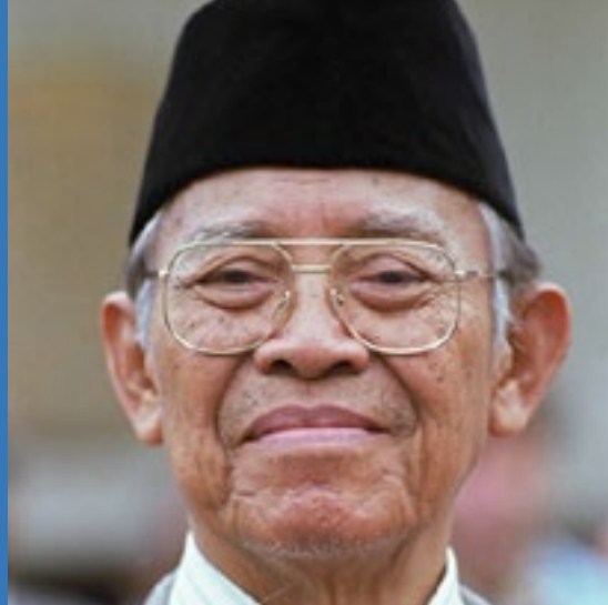
Bapak Muhammad Subuh Sumohadiwidjo Foto: Simón Cherpitel