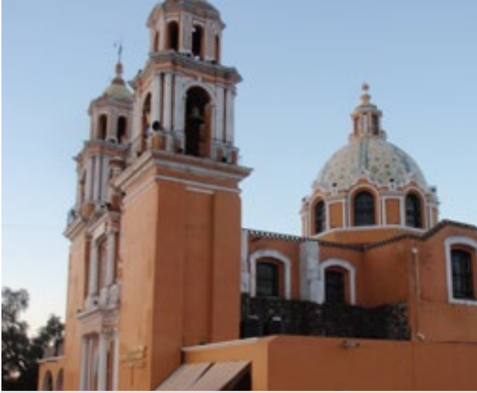
Iglesia de los Remedios que se encuentra en Cholula, México, asentada en la pirámide más grande del mundo construida por el hombre