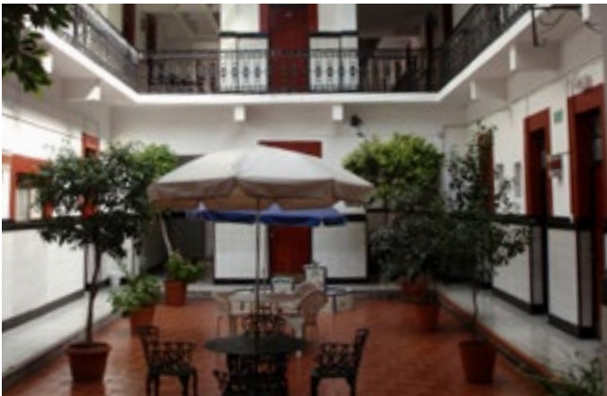
Esta disponible una amplia variedad de alojamientos de 4 y 5 estrellas

También hemos estado negociando con los hoteles y los precios oscilan entre 25 y 35/40 dólares en hoteles de 2-4 estrellas (habitación doble). Otros hoteles están entre 60/100 dólares por persona (habitación doble) La mayoría de los hoteles también tienen algunas habitaciones triples y cuádruples, así que los precios pueden llegar a ser muy bajos. Estos precios, a los que los miembros tendrán acceso a través de la página web del Congreso Mundial, incluirán un desayuno continental completo. Los miembros del extranjero que están inscritos en el Congreso Mundial también tendrán un descuento del 16% sobre los precios publicados, lo cual se debe a la condición de exención de impuestos del congreso si pagan con tarjeta de crédito internacional. Estamos mirando precios más bajos para los jóvenes.