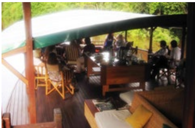
Miembros de la Zona disfrutando de un día de crucero bajando el río Kahayan