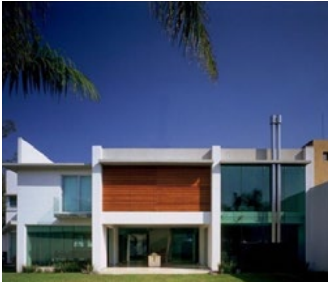
Diseño de la nueva Casa Subud para los miembros en Medan, Indonesia

Para más información, por favor contacten con Subud Medan Email: subud.medan@gmail.com