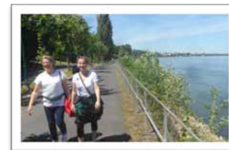
Прогулка вдоль Рейна в Бонне, недалеко от Конгресс-центра.