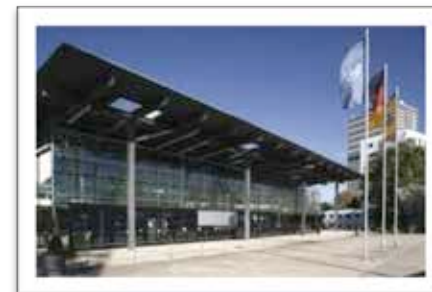
The World Conference Center Bonn with the UN Campus in the background.

Боннский Конгресс-центр располагает 40 отдельными помещениями для семинаров или тестов и несколькими большими залами для утренних и вечерних латиханов. Это делает конференц-центр идеальным местом для проведения Конгресса. Всё находится в одном месте. Тот, кто захочет побыть на природе в перерыве между заседаниями или семинарами, может просто выйти из здания и сразу оказаться на набережной Рейна или пойти в Rheinaue-Park неподалёку. Любопытная деталь: в этом парке стоит скульптура работы Рихарда Энгельса из Вольфсбурга.