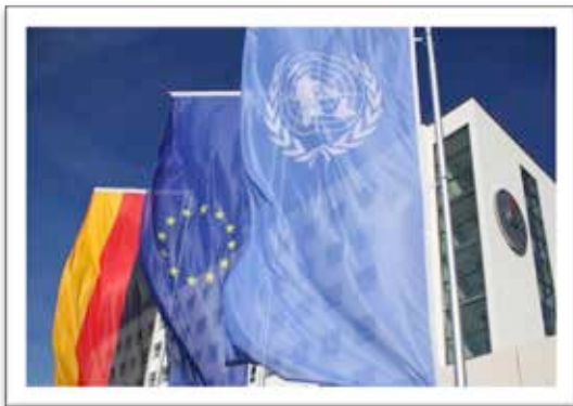
The UN campus in Bonn, adjacent to the World Conference Center Bonn (WCCB)