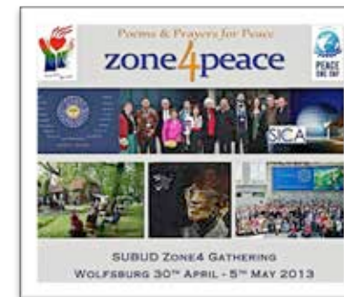
A SICA event at the Zone4 gathering in Wolfsburg: an evening

Разнообразие культур, языков и религий является частью наследства и создает сложность 4 й Зоны. Большинство стран Зоны в той или иной форме были связаны с Германией, разделяют с ней общую, часто проблематичную историю. Некоторые страны 4 й Зоны находятся в трудных и даже опасных политических ситуациях. Крепкая внутренняя связь и взаимопонимание совершенно необходимы, чтобы превозмочь отчуждение. Субуд и латихан дают нам возможность найти силы для того, чтобы преодолеть все границы и показать «внешнему миру» возможность вместе жить и работать в гармонии. Лучшая возможность показать и поддержать этот процесс - это взять на себя ответственность провести живой и яркий Конгресс в нашей части света.