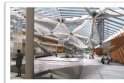
The World Conference Center Bonn – the new building . The designated venue for the Subud World Congress 2018.