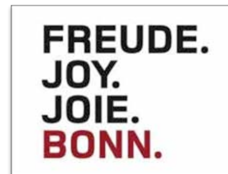
Радость, девиз города

Мы хорошо подготовлены и в то же время открыты любому результату теста в Пуэбле. Всемирный Конгресс в Пуэбле выберет страну (организацию Субуда), в наибольшей степени способную служить международному сообществу Субуда в качестве «рабочей площадки» на следующие четыре года. Речь идёт о более широкой перспективе: рост будет продолжаться к нашей общей пользе. Даже если Конгресс достанется другой стране, а не Германии, мы уже чувствуем, что работа над этим проектом было благословением для нас. Мы просто верим в процесс латихана: он покажет, что лучше для Субуда в ближайшие четыре года.