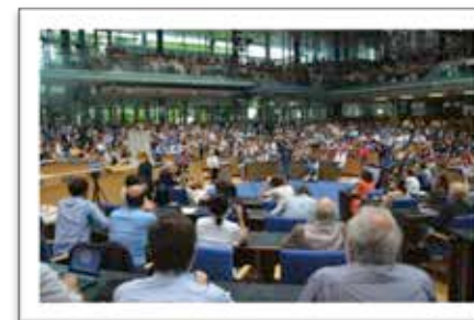
The World Conference Center Bonn – the Plenary in action.