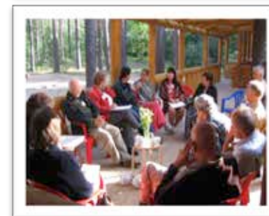
At the Zone4 gatherings in Wolfsburg and in Moscow, Russia