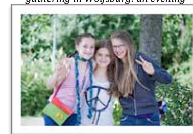
Joyous girls at a Subud congress