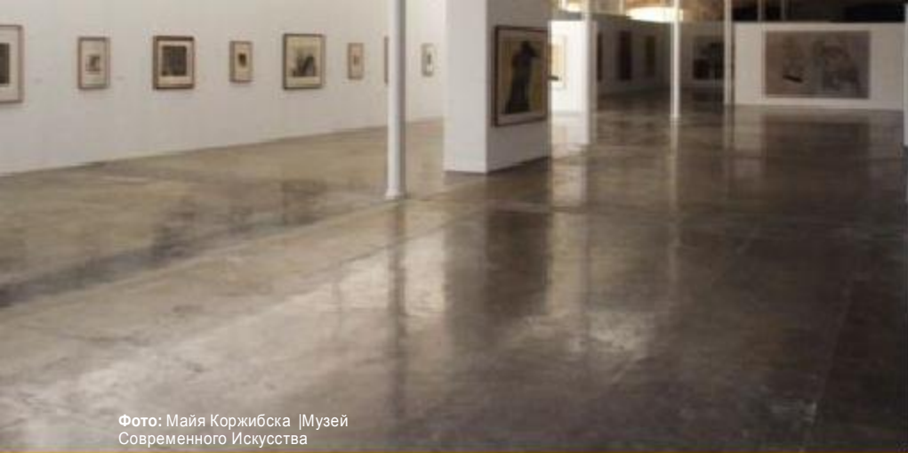
Фото: Майя Коржибска |Музей Современного Искусства