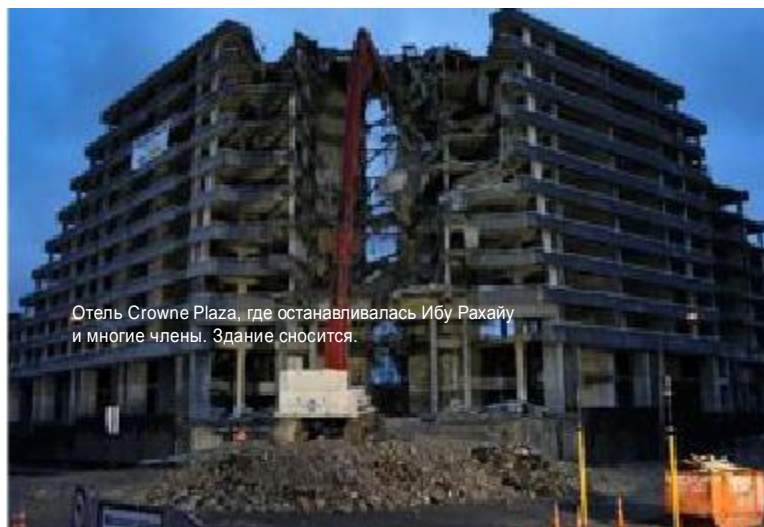
Отель Crown Plaza, где останавливалась Ибу Рахайу и многие члены. Здание сносятся.

Я приехал в разрушенный центр Крайстчерч и совершенно растерялся. Я «знал», где я был, но отсутствие знакомых ориентиров сбивало с толку. Это длилось недолго, но эффект был мгновенно дезориентирующим, как кратковременное помешательство, когда слова вдруг теряют свой смысл или знакомые лица узнаваемость.