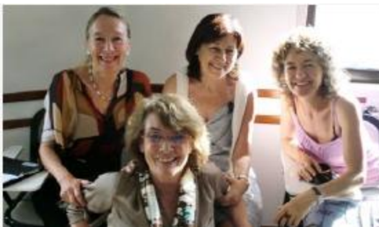
Фото: Члены Зоны 3 с председателем Зоны (впереди) Паломы де ля Вина