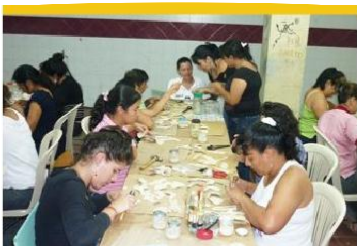
Колумбия: женщины учатся, как шить обувь (Букараманга, Колумбия).