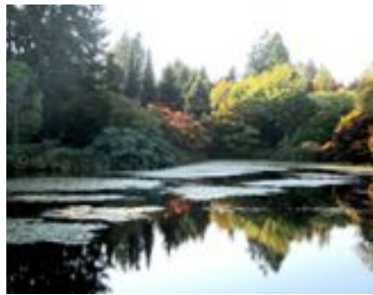
Photo: Jardins paysagers à Vancouver Avec la gracieuse permission de Miranda Ranger