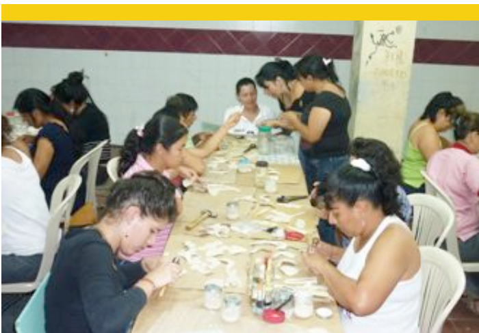
Légende de la photo : Des femmes apprennent à confectionner des chaussures à Bucaramanga, Colombie

Intéressés ? Contactez silvana@yesquest.org