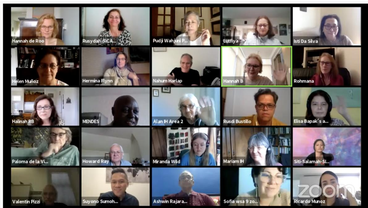
Día 1 WSC Reunión Periódica– Julio2021

Al hacer el proyecto, Elisa trabaja muy estrechamente, con Ami en los Archivos de audio de Cilindak (para el mejor audio, las Charlas de audio de Memnon), y con SPI, los traductores y la Biblioteca Subud. Ella da gracias a todos por ayudar en el proceso de las Charlas subtítulos en video.