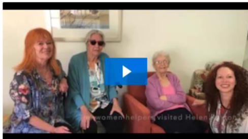
The Adelaide Group