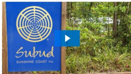
The Sunshine Coast Group