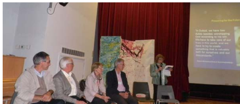
El equipo de la MSF durante la "premier" de las películas presentadas durante el Encuentro Europeo y el Congreso Nacional de Subud Gran Bretaña en Malvern, en agosto. Al final hubo una sesión de preguntas muy animada, donde los miembros preguntaron sobre el trabajo de la Fundación y el proyecto "El Legado de Bapak".

BPI www.borneoproductionsinternational.com begin. www.beginchange.co