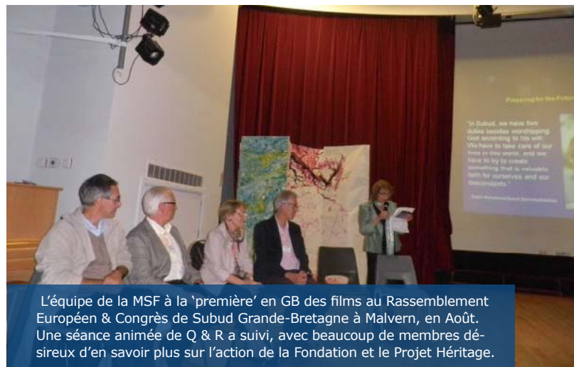
L'équipe de la MSF à la 'première' en GB des films au Rassemblement Européen & Congrès de Subud Grande-Bretagne à Malvern, en Août. Une séance animée de Q & R a suivi, avec beaucoup de membres désireux d'en savoir plus sur l'action de la Fondation et le Projet Héritage.

BPI www.borneoproductionsinternational.com begin. www.beginchange.co