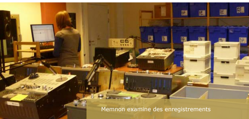
Memnon examine des enregistrements

Le pourcentage de problèmes d'enregistrements a depuis augmenté.