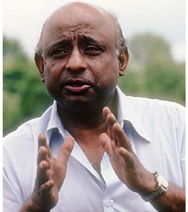
Varindra Vittachi, también conocido como "Tarzie", sirvió en diversas funciones en Naciones Unidas durante más de dos décadas. Se retiró como Subdirector Ejecutivo del Fondo de las Naciones Unidas para la Infancia en 1988.

Los trustees se han comprometido a respetar los importantes principios de transparencia, rendición de cuentas e información, que son esenciales para una institución que busca tener y mantener una relación de confianza y credibilidad con sus miembros.