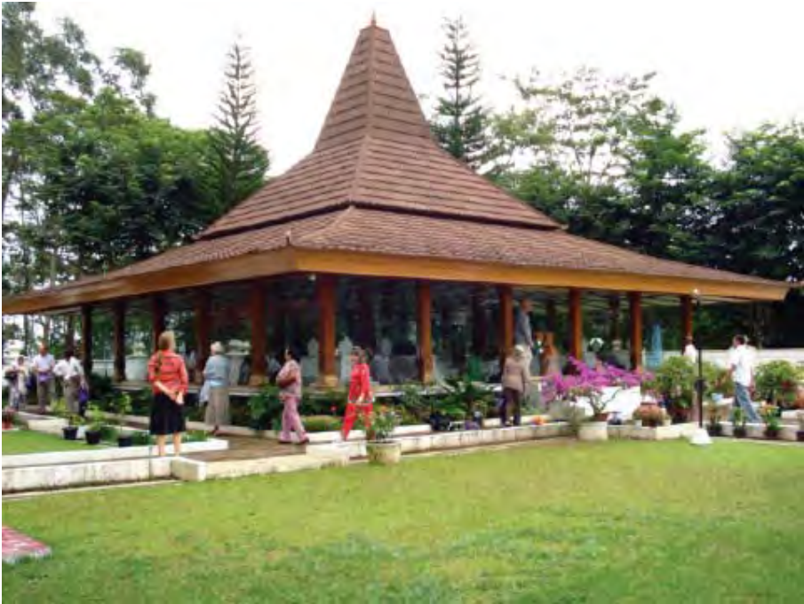
Fotografía de la portada y arriba: Miembros Subud, presentando sus respetos en la tumba de Bapak, Suka Mulya, Indonesia.