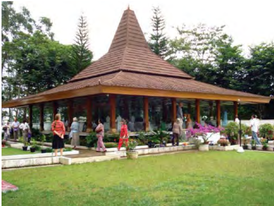
Photo de couverture et dessus : Membres Subud rendant hommage à la tombe de Bapak, Suka Mulya, Indonésie.