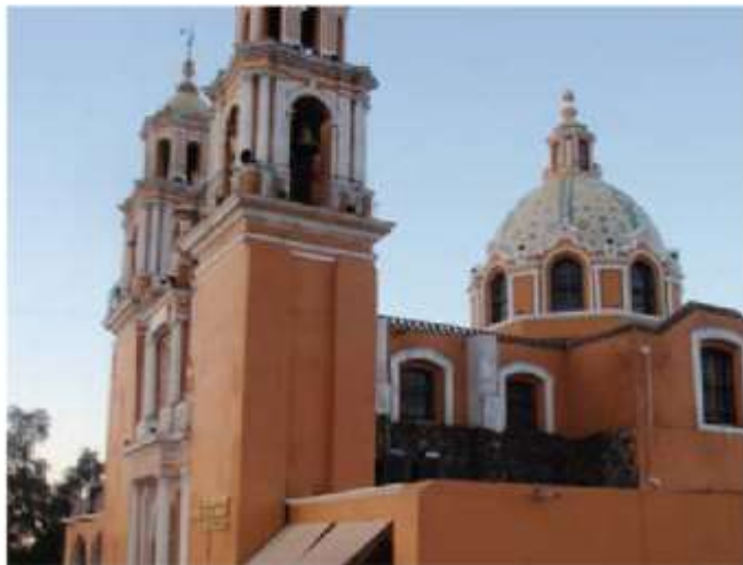
Церковь Ля Иглесиа стоит наверху самой большой в мире пирамиды, построенной человеком, в Пуэбла.