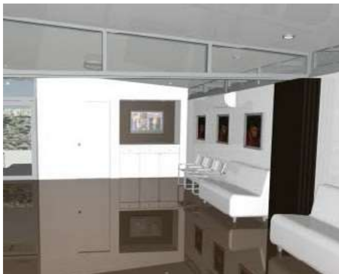
Интерьер будущего Субуд дома в Бангкоке. Дизайнер – Латиф Фогель

Если вы хотите посетить Индонезию, просмотрите новый сайт Wisma Subud . Там вы найдете информацию о том, как посетить дом Бапака в Семаранге, где он роился, субудский поселок Рунган Сари в Центральном Калимантане. www.wismasubud.org