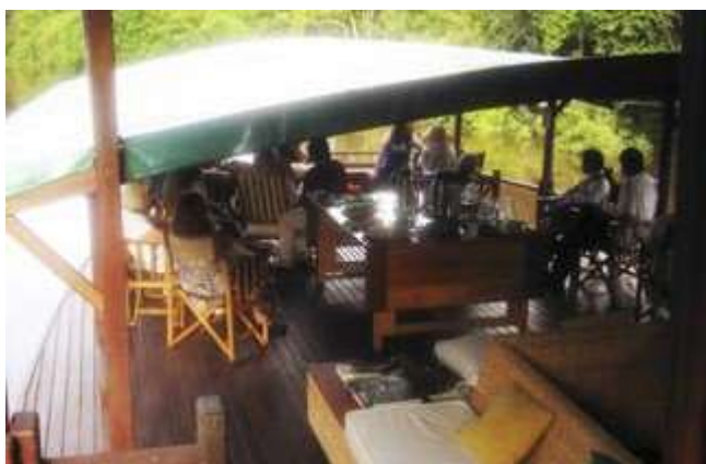
Участники наслаждаются круизом по реке Кахайян