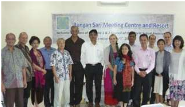
Members of Zone 1 & 2 at the Rungan Sari Resort