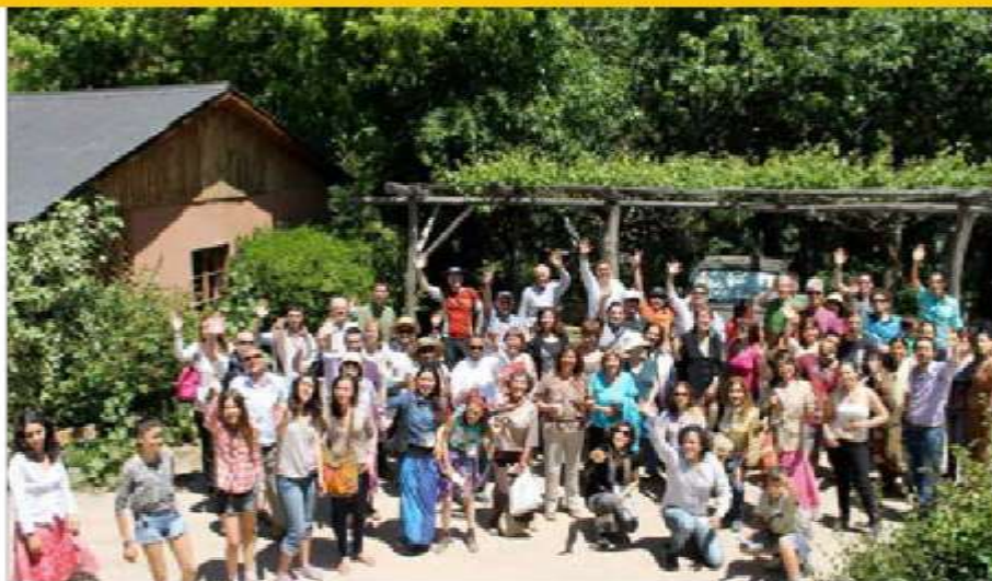
More than 100 people travelled to the scenic Cajon del Maipo mountains in Chile for the Zone 9 gathering.