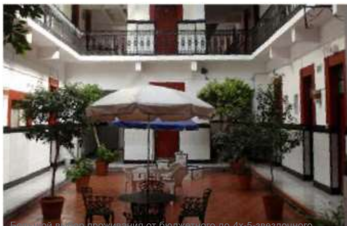
Большой выбор проживания от бюджетного до 4х-5 звездного.

Мы вели переговоры с различными гостиницами, цены - от $25 до $35/40 на человека в 2х-местном номере. В гостиницах более высокого класса цены колеблются от $60 до $100 на человека. В большинстве гостиниц также имеются 3х- и 4х-местные номера, цена на которые ниже. В эти цены, которые члены смогут найти на сайте Всемирного конгресса, будет включен завтрак. Те участники, которые будут расплачиваться международной кредитной карточкой, получают скидку 16%. Сейчас мы ищем еще более низкие цены для молодежи.