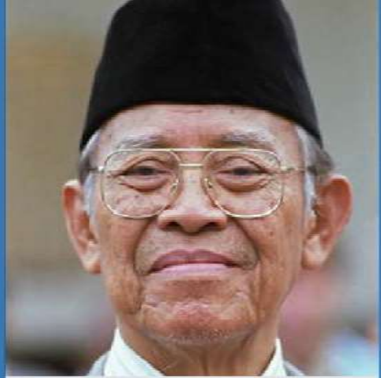
Бапак Мухаммад Субух Сумохадживиджойо