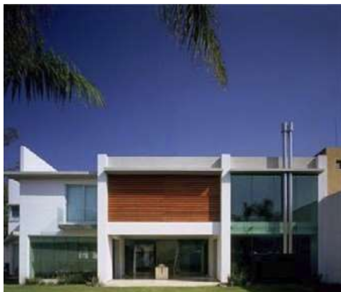
Проект нового Субуд Дома в Медане, Индонезия.