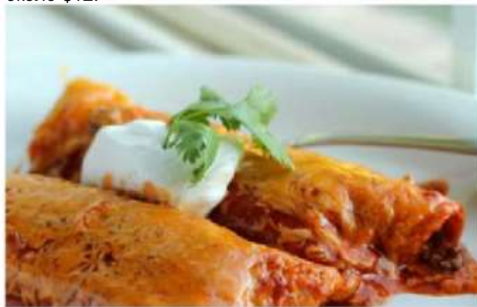
A varied menu is planned and Puebla is known for its authentic Mexican cuisine.

У нас есть широкий выбор компаний общественного питания, одно из них – ассоциация шеф-поваров, ведь Пуэбла – известный гастрономический центр. Эти шеф-повара преподают в университете и предлагают разнообразное меню на две недели конгресса, чтобы еда не надоела. Трехразовое питание будет стоить около $12.